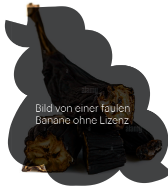
Bild von einer faulen Banane ohne Lizenz